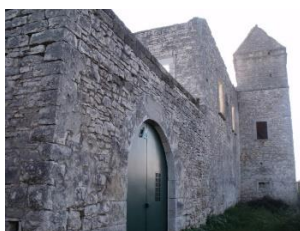
Fig.2- Torre Ricchizzi, ingresso e torre colombaia.

La torre, a pianta rettangolare, è una tipica torre d'avvistamento interna rispetto alla costa e faceva parte di un sistema di strutture costruite per la salvaguardia dei casali sparsi sul territorio circostante. Tutto il complesso è costruito con blocchi di calcare di varie dimensioni, ad eccezione delle parti terminali e del muro di cinta. Essa è costituita da tre elementi distinti. Il primo, è costruito con conci calcarei di varie dimensioni e forma, legati con una abbondante malta rossastra. Al suo interno presenta due vani sovrapposti; quello inferiore, con una apertura quasi quadrata ad altezza d'uomo rivolta verso nord, (fig. 2).