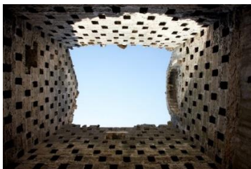
Fig.3- Interno della colombaia.

che permetteva di controllare a distanza il portale d'accesso alla masseria. Il vano superiore mostra due finestre rivolte rispettivamente a nord ed a ovest ed una porta d'accesso ad est. Un toro marcapiano separa questo elemento da un terzo sovrastante, costruito successivamente con conci giustapposti di calcarenite (tufo) regolarmente squadri in parallelepipedi, che trasforma la torre in una colombaia. Il tetto a due falde era realizzato con "chiancarelle", lastre naturali di calcare con spessore variabile di 3-5 cm., sbazzate a forma rettangolare e disposte a guisa di tegole su travi di legno. Il crollo del tetto, che travolse anche il solaio sottostante, ha messo in luce la colombaia (fig.4), costruita con liste di blocchi tufacei sfalsati tra i quali si aprono circa trecento celle per colombi, attualmente occupate da una colonia di un centinaio di colombi selvatici.